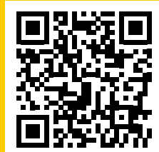
Alle Fahrpläne und weitere Informationen: www.ammerguer-alpen.de/ringbus